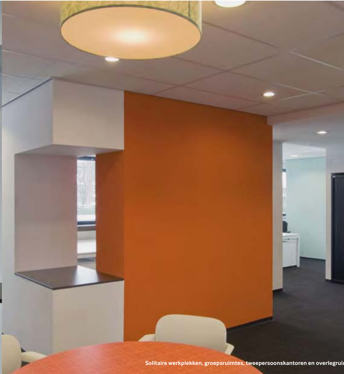
Solitaire werkplekken, groepsruimtes, tweepersoonskantoren en overlegruimtes zijn in het kantoor door elkaar geplaatst.