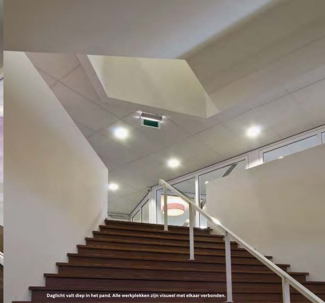
Daglicht valt diep in het pand. Alle werkplekken zijn visueel met elkaar verbonden.

Het interieur van het kantoor van de MBO Raad in Woerden bouwt voort op het concept van het salonkantoor, dat Bos Alkemade Architecten in 2007 introduceerde in het hoofdkantoor van Altra in Amsterdam. Met het salonkantoor wil het bureau de nadelen van het flexkantoor ondervangen. Het idee is om ruimte te besparen en tegelijkertijd iedere werknemer een eigen, vaste werkplek te bieden. Dat wordt bereikt door een eenvoudige beslissing: de gangen zijn uit het ontwerp weggelaten. De diverse vertrekken – solitaire werkplekken, tweepersoonskamers, overlegplekken – lopen in een grote dichtheid letterlijk in elkaar over. Het programma van eisen dat de MBO Raad neerlegde, liet zich goed in het concept van het salonkantoor inpassen; de organisatie heeft veel kenniswerkers die een substantieel deel van hun tijd op kantoor doorbrengen en daarom gebaat zijn bij een