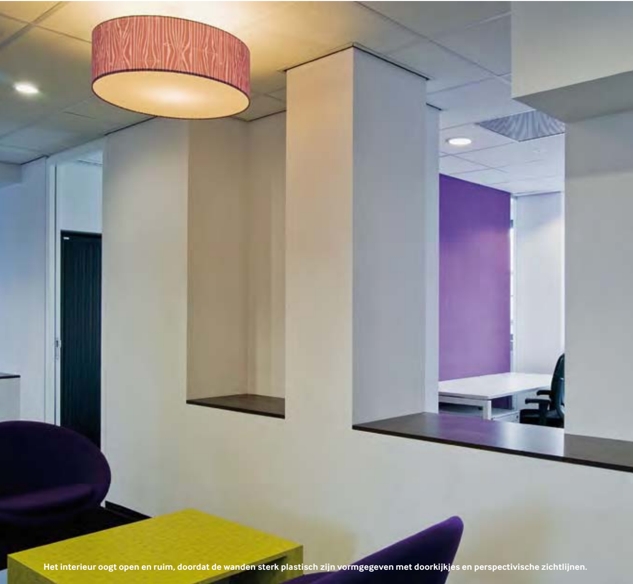
Het interieur oogt open en ruim, doordat de wanden sterk plastisch zijn vormgegeven met doorkijkjes en perspectivische zichtlijnen.