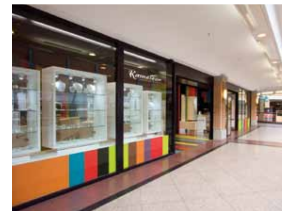
FOTO LINKER PAGINA